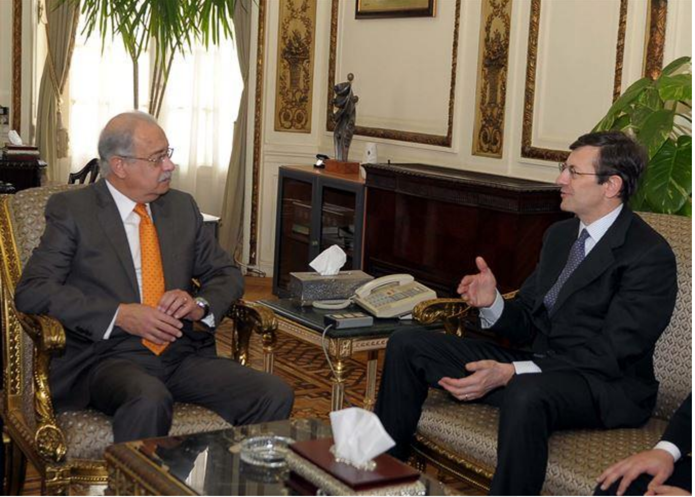
رئيس الوزراء يستقبل رئيس شركة فودافون

التقى المهندس شريف إسماعيل، رئيس مجلس الوزراء، صباح الخميس، فيتوريو كولانو، الرئيس التنفيذي لمجموعة فودافون العالمية ، بحضور ياسر القاضي، وزير الاتصالات وتكنولوجيا المعلومات.